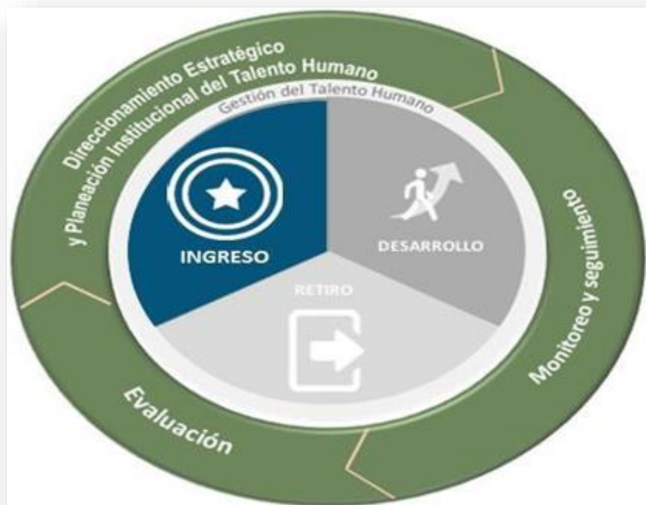
Figura 4. Modelo del Empleo Público

En este sentido se entiende la GETH como el conjunto de buenas prácticas y acciones críticas que contribuyen al cumplimiento de metas organizacionales a través de la atracción, desarrollo y retención del mejor talento humano posible, liderado por el nivel estratégico de la organización y articulado con la planeación institucional. Esta concepción implica la necesidad de articular estratégicamente las diferentes funciones relacionadas con talento humano, alineándolas con los objetivos misionales.