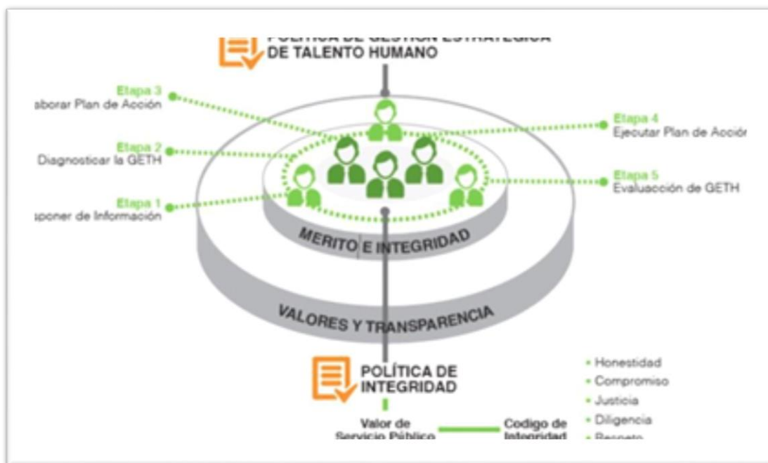
Figura 2. Dimensión del talento Humano

La estrategia comparte con el modelo Integrado de Planeación y Gestión MIPG una visión del talento humano como uno de los ejes principales dentro de la gestión en las entidades públicas, lo concibe como el gran factor crítico de éxito para una buena gestión que logre resultados, como el activo más importante con el que cuentan las organizaciones para resolver las necesidades y problemas de los ciudadanos, esto explica que el tema de talento humano ocupe el centro del MIPG.