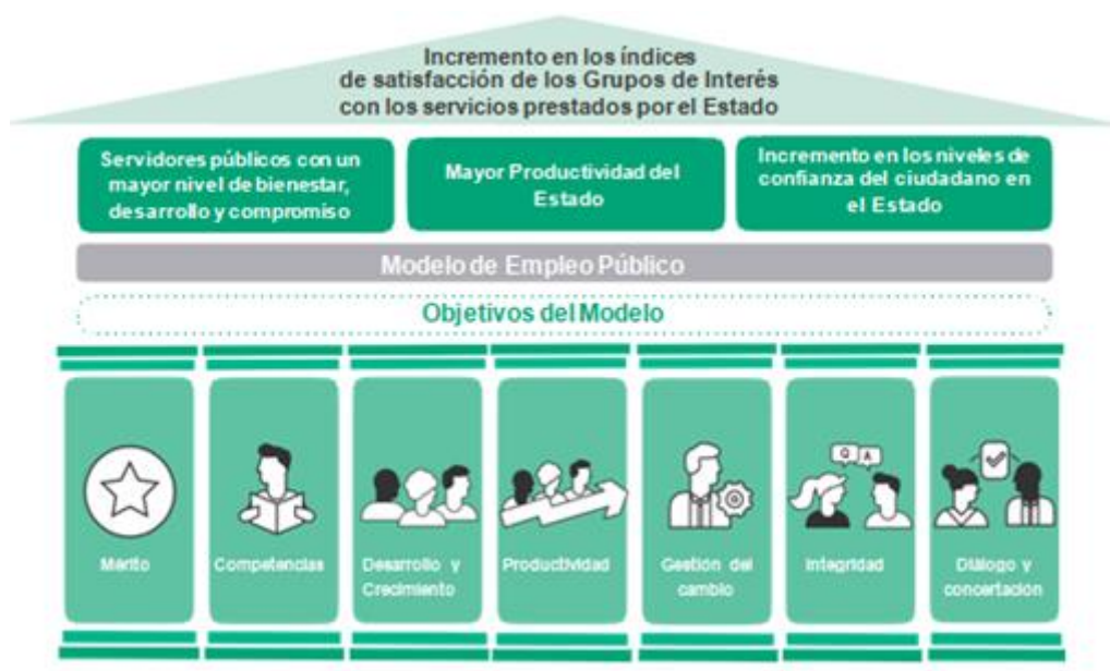
Figura 3. Marco estratégico

La gestión estratégica del talento humano -GETH- se desarrolla en el marco general de la política de empleo público y se fundamenta en los siguientes pilares: 1) el mérito, criterio esencial para la vinculación y la permanencia en el servicio público, 2) las competencias, como el eje a través del cual se articulan todos los procesos de talento humano, 3) el desarrollo y el crecimiento, elementos básicos para lograr que los servidores públicos aporten lo mejor de sí en su trabajo y se sientan partícipes y comprometidos con la entidad, 4) la productividad, como la orientación permanente hacia el resultado, 5) la gestión del cambio, la disposición para adaptarse a situaciones nuevas y a entornos cambiantes, así como las estrategias implementadas para facilitar la adaptación constante de entidades y servidores, 6) la integridad, como los valores con los que deben contar todos los servidores públicos, y 7) el diálogo y la concertación, condición fundamental para buscar mecanismos y espacios de interacción entre todos los servidores públicos con el propósito de lograr acuerdos en beneficio de los actores involucrados como garantía para obtener resultados óptimos. (MIPG, 2017)