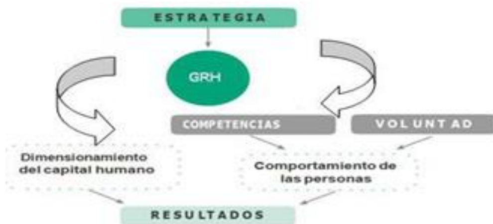
Figura 1. Creación de valor público

Para la formulación y construcción del Plan tiene como base el documento de análisis del contexto de la entidad, el cual identifica los factores internos y externos que deben ser tenidos en cuenta para la formulación de las estrategias y acciones permitiendo así proyectar una intervención pertinente que atienda las necesidades y expectativas del sector y la entidad.